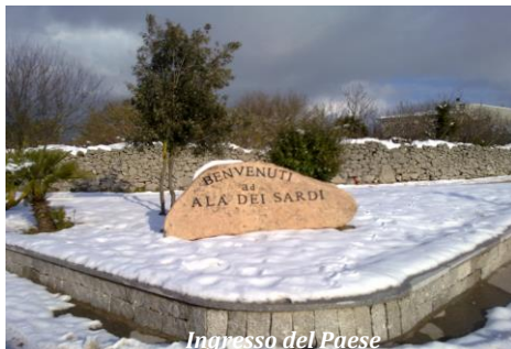
Ingresso del Paese